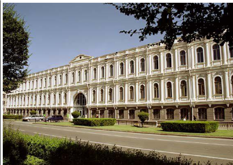
Ставропольский государственный краеведческий музей им. Г.Н. Прозрителева и Г.К. Праве