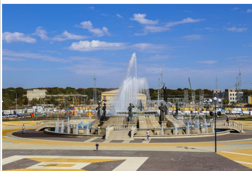
Площадь святого князя Владимира, музей «Россия – моя история»

Тифлисские ворота (Триумфальная арка) – один из самых известных памятников города. Согласно архивным данным, строительство арки было начато в 1841 г. Известно, что Тифлиссские ворота выполняли функции восточных городских ворот. Сооружение ворот совпало с подготовительным процессом к празднованию 30-летней годовщины Бородинского сражения. Поэтому главным украшением торжества стала именно Триумфальная арка. Дальнейший путь приводит к памятнику генералу А.П. Ермолову , который был направлен в Ставрополь в качестве проконсула Кавказа. Памятник установлен в 1998 году.